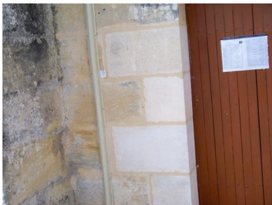
Remplacement de pierres

Le mauvais état des pierres et des traces conséquentes d'humidité ont nécessité la réhabilitation totale de la façade est.