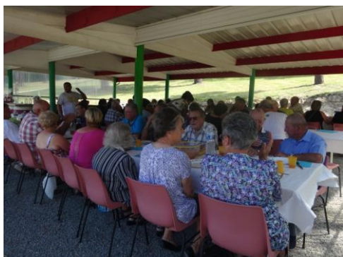
Repas de chasse